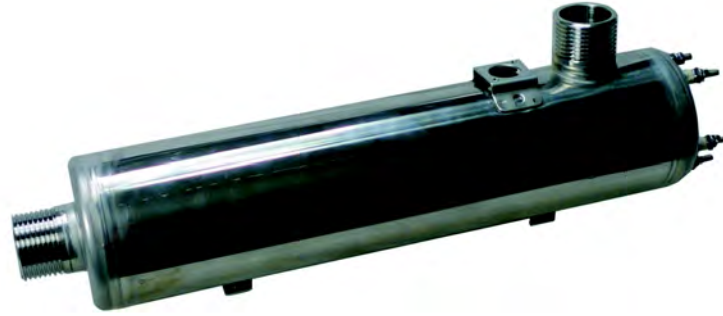
垂直的(A, B, C)